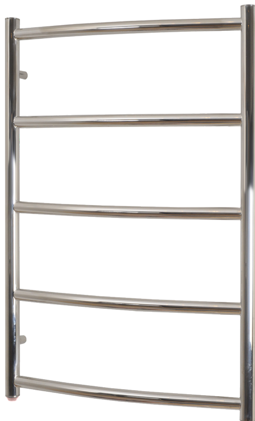
SN6543PE (45Watt) 800x530mm (HxB)