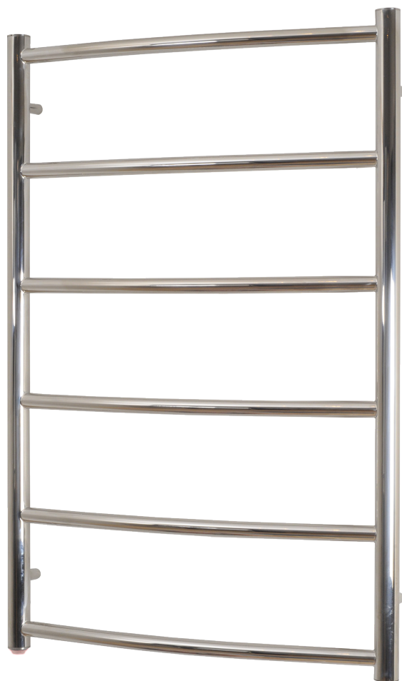
SN8053PE (60Watt) 800x530mm (HxB)

Følgende produkter er omfattet af nærværende dokument